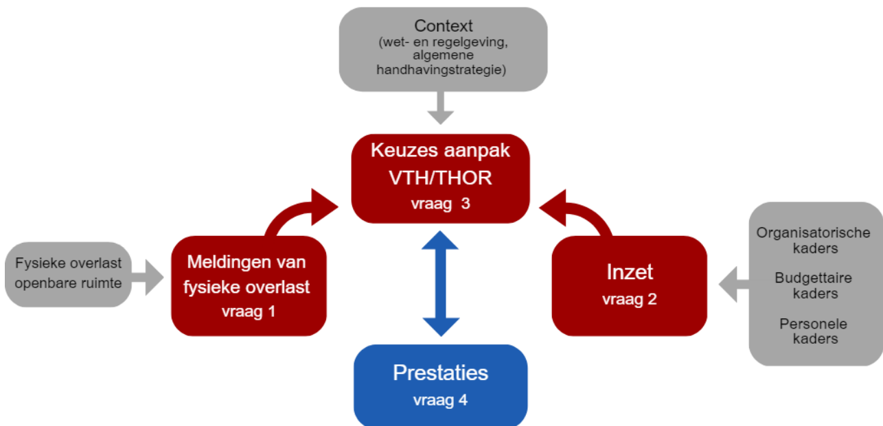
Figuur 2 Opzet onderzoek

Deze focus in het onderzoek leidt tot de volgende centrale vraag: